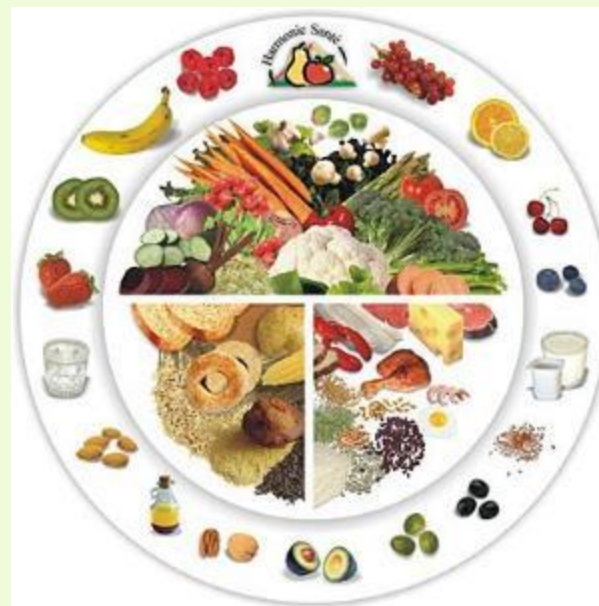
ВНЕУРОЧНАЯ ДЕЯТЕЛЬНОСТЬ «РАЗГОВОР О ПРАВИЛЬНОМ ПИТАНИИ»